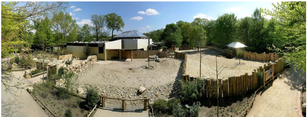
Het nieuwe verblijven voor neushoorns

Zijn ressort zijn de commerciële en economische leiding, vooral de personeelszaken, kassa- en bedrijfsadministratie, maar ook de uitwerking van economische en financiële plannen. In deze verantwoordelijke taken wordt de commerciële directeur gesteund door een assistent (controlling). Verder werken in het commerciële divisie 4 medewerkers en nog 4 kassiers, die in de 'hoofd'-seizoen wel door hulpkrachten worden gesteund.