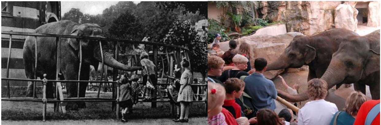
Olifanten: ongeveer 1952 en de oude zoo - en 2008 in de nieuwe zoo