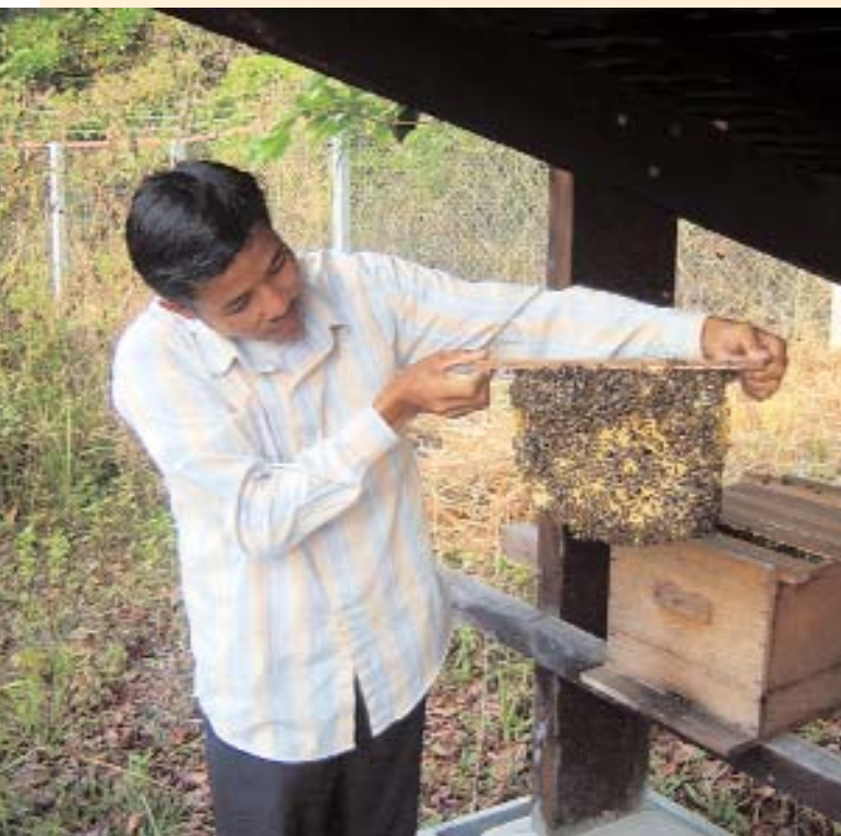
Mit Projekten wie der Einführung der Imkerei in den Dschungel-Dörfern vermittelt das ACCB den Einheimischen erfolgreich, mit der Natur statt auf Kosten der Natur zu leben.

Gleichzeitig schafft das ACCB Arbeitsplätze für die Einheimischen, die so erstmals mit dem Erhalt statt der Ausbeutung des Dschungels Geld verdienen können. Nur gemeinsam mit den Menschen Kambodschas kann das ACCB Tiere und Natur retten. Nur gemeinsam mit Ihnen kann das ACCB seine wichtige Arbeit erfolgreich fortführen.