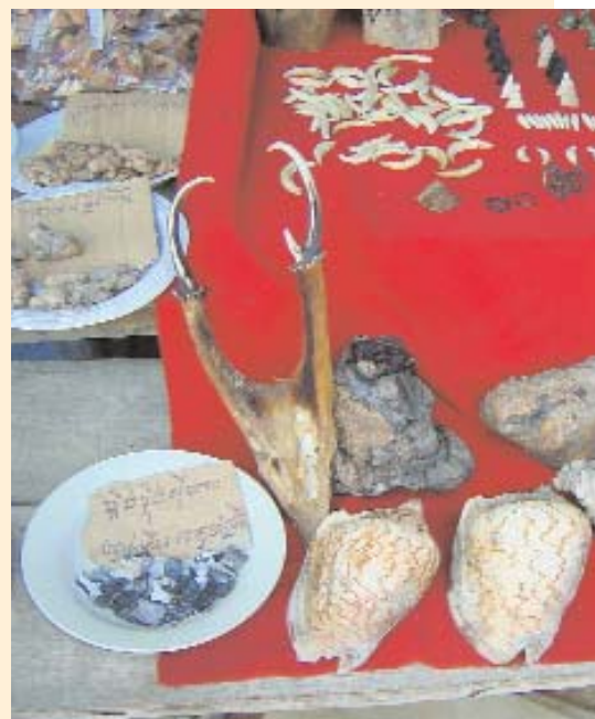
Volle Tische auf den Märkten zeigen das Ausmaß, in dem die Natur Kambodschas geplündert wird.

rückgegeben wird, ist ein kleines Puzzleteil, mit dem das Ökosystem Stück für Stück wieder zusammengesetzt wird.