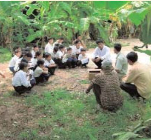
Lernen für die Zukunft: Die Mitarbeiter des ACCB bringen den kambodschanischen Kindern bei, mit der Natur zu leben und die Umwelt zu respektieren.

Auch wenn die Einheimischen Tiere fangen und Wälder roden, kann das ACCB nur zusammen mit den Menschen den Dschungel retten. Denn oftmals ist es einfach mangelndes Wissen, das zur Zerstörung der Natur führt.